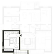
VUE EN PLAN - NIV 03 1:200